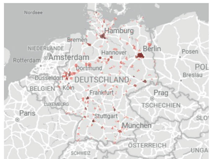
Abbildung 1 - auf der Plattform gemeldete Wärmenetze (hell zu dunkel nach Wärmeabsatz)

Mittlerweile sind auf der Preistransparenzplattform 564 Teilnetze gemeldet mit einem Gesamtwärmeabsatz von 56.848.356 MWh. Damit bilden wir bereits runde die Hälfte des Fernwärme-marktes in Deutschland ab.